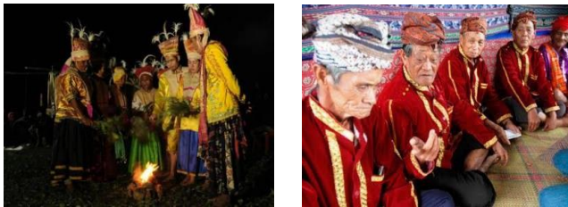
Gambar 3.2. Pertunjukan Tarian Balia oleh Tokoh Adat Masyarakat Boneoge

Keinginan masyarakat agar wisatawan juga menyaksikan praktik gotong royong, seperti membersihkan pantai, menandakan bahwa pelestarian budaya di Boneoge tidak berdiri sendiri, melainkan menyatu erat dengan kepedulian terhadap lingkungan dan semangat kolektif. Hal ini menunjukkan bahwa masyarakat Boneoge tidak hanya ingin budaya mereka dihargai sebagai tontonan